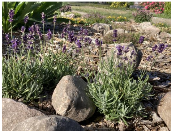
BIENENWEIDE FRIEDHOF HOHNE